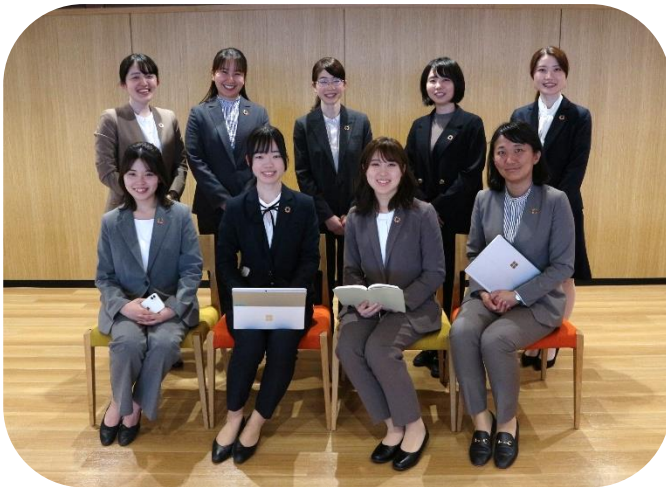
2025年度 Jewelia メンバー