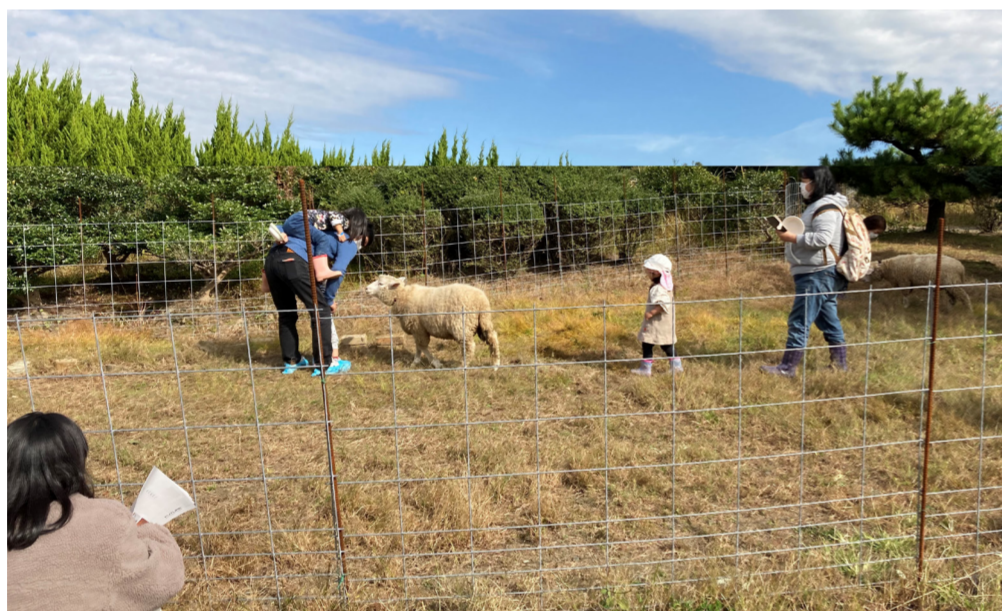
ひつじサミット尾州① ひつじの森

三星ケミカル株式会社では、リサイクル事業を開始いたします。お客さまの工程内で廃棄される樹脂を回収し、再利用可能な形にして改めてご提供します。サプライチェーンのなかにリサイクルの機能が生まれます。