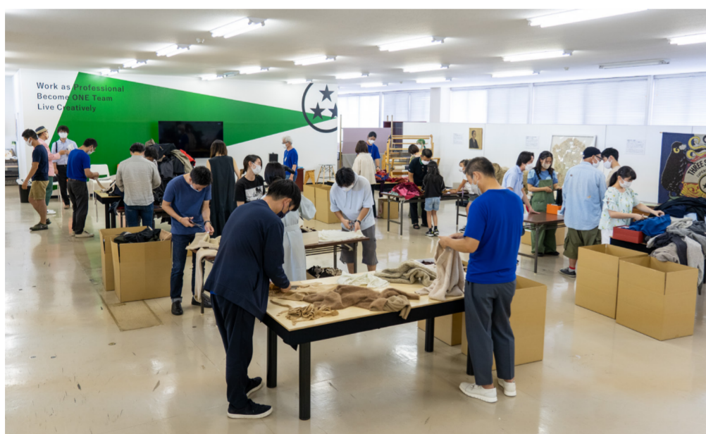
リバースウール① 回収衣料を小さく裁断