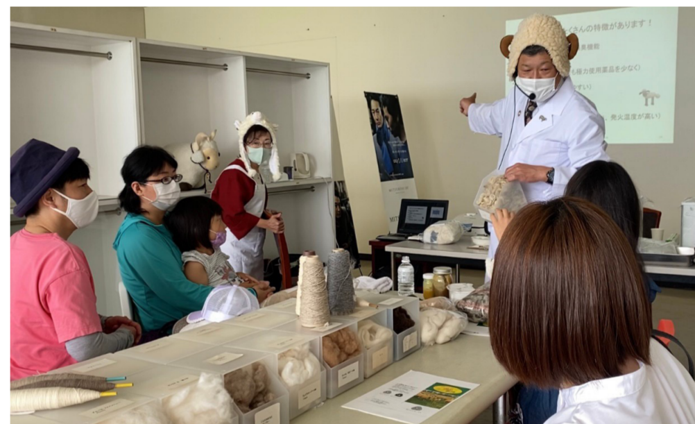
ひつじサミット尾州③ 科学教室