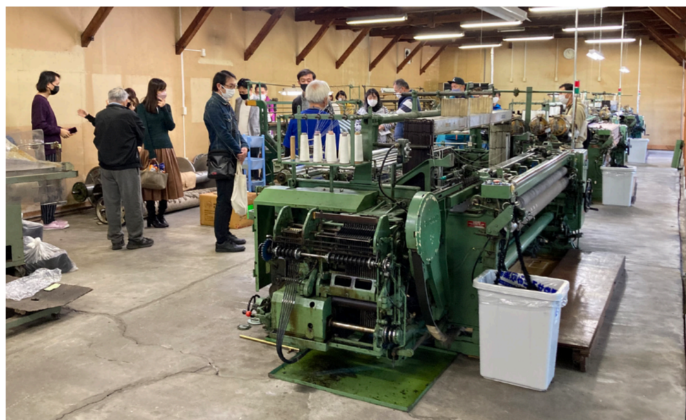
ひつじサミット尾州② ファクトリーツアー